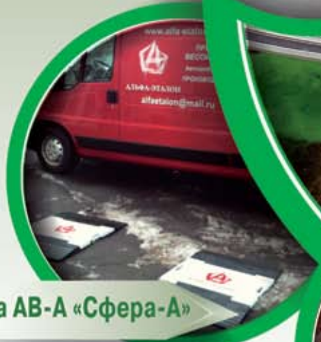
Альфа АВ-А «Сфера-А»