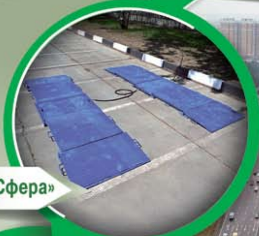
Альфа АВ-А «Сфера»