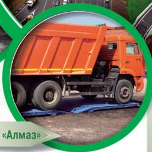
Альфа АВ-А «Алмаз»